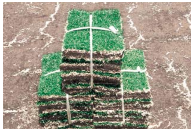
普通判 36cm×28cm×10枚 (1㎡) どんな場所にも容易に植付作業ができる規格品です。