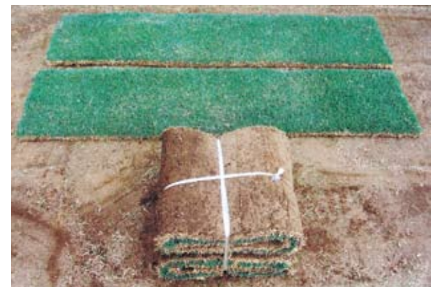
ロール判 36cm×140cm×2枚 (1㎡) 効率的に造園工事ができます。