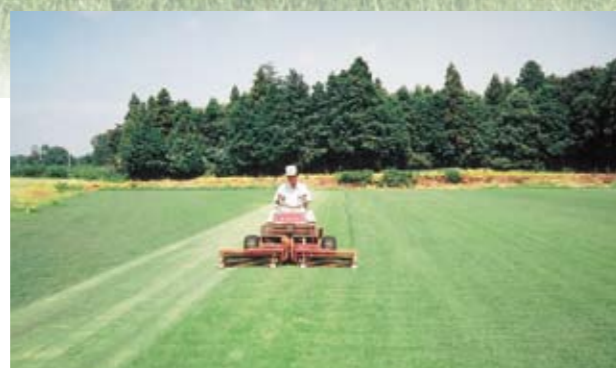
葉刈り 高品質な芝づくりのため、夏期には月3回以上、葉刈り作業を行います。