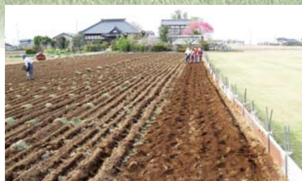
植付け 3月～4月に筋植えします。