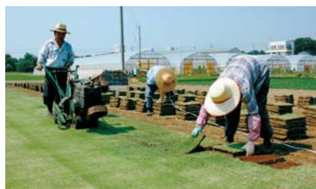
切取り 注文に応じて切り取ることで、新鮮な芝を提供いたします。