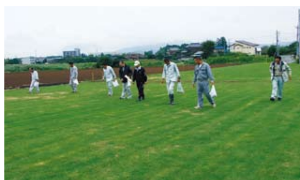
検査 混種や生育状態を確認するため、年3回定期的に圃場検査を実施します。